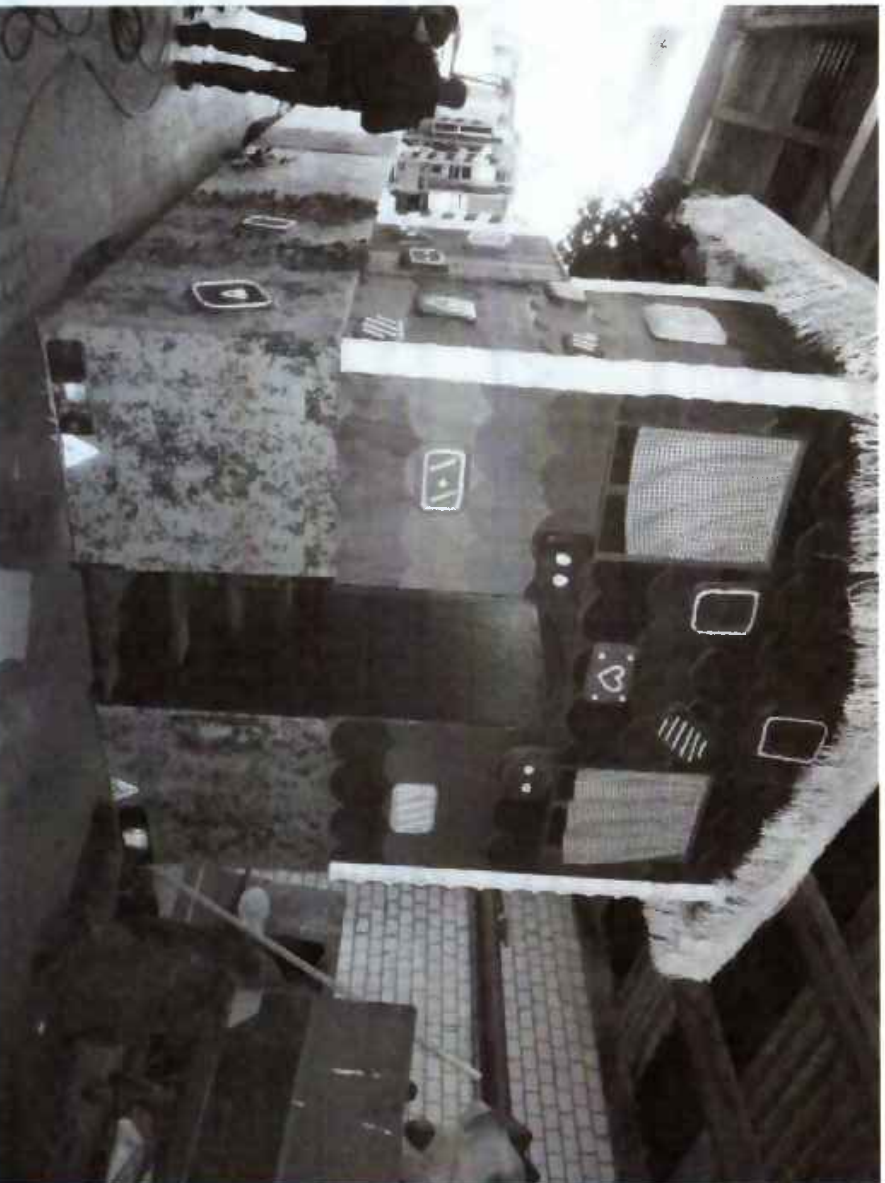
Anlage 1 zu Pkt.2 Biddokumentation 2015/16 587-10 524. 2010-1917