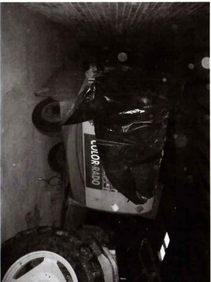
Anlage 1 zu Pkt.2 Bilddokumentation 2015/16 577-14